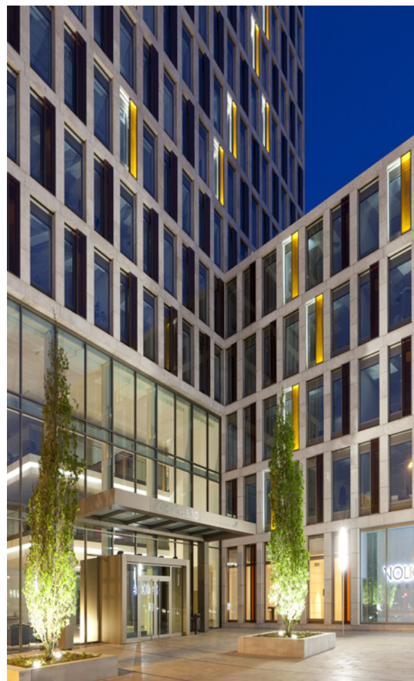
Quelle: ©Architekt: nps tchoban voss Arch.Foto: Christoph Seelbach Fotografie / © Saint-Gobain Glass

Sollte es doch mal zu einem Glasbruch kommen, zerfällt das Einscheiben-Sicherheitsglas (ESG) SECURIT in kleine stumpfkantige, lose zusammenhängende Glaskrümel und erfüllt somit die Anforderungen an ein Sicherheitsglas.